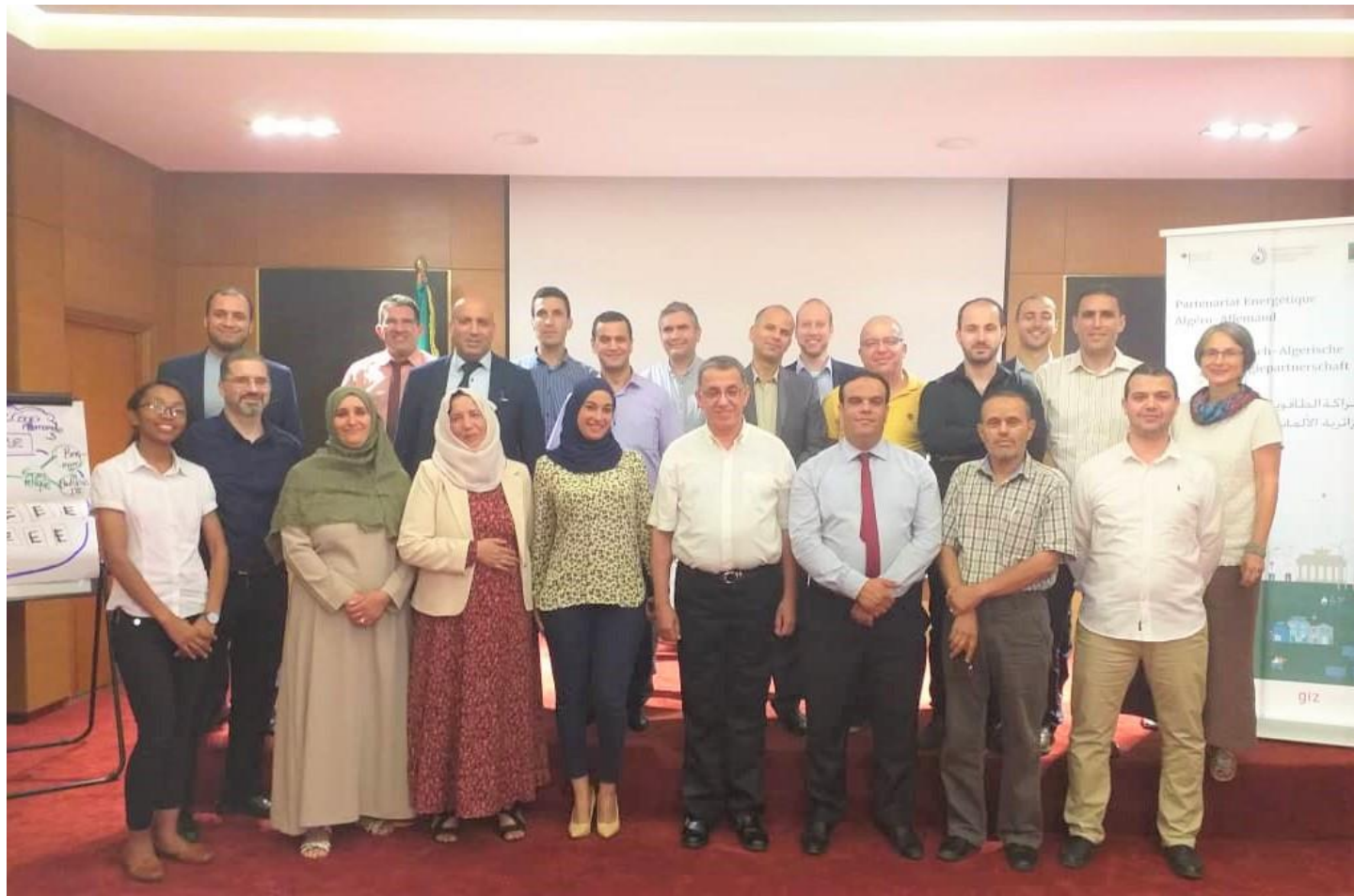
Photo du groupe ayant suivi les deux ateliers de formation